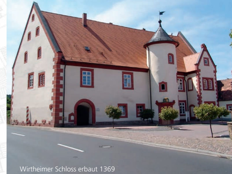
Wirtheimer Schloss erbaut 1369